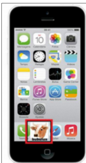
Figura 1 – Ícone do aplicativo

usuário selecione os ícones que mostram os sintomas do animal, e após essa seleção clicaria em um ícone denominado “OK”, como mostra a Figura 2: