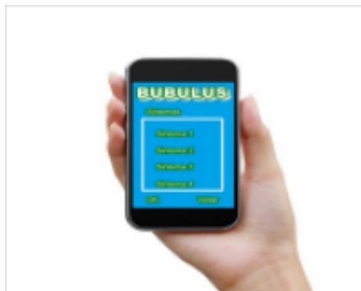
Figura 2 – Tela Principal do Aplicativo